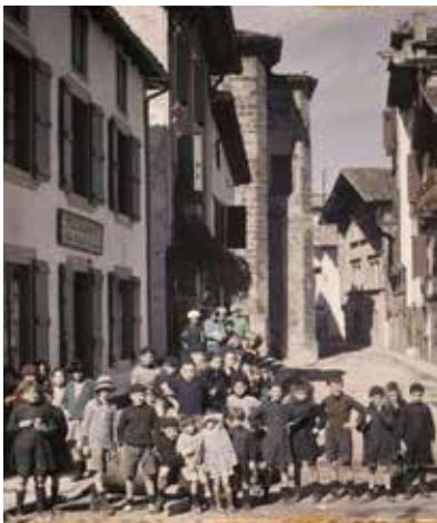
Auguste Léon - Ciboure, rue Pocalette à la sortie de l'école 1924

Conçue avec le Musée Basque de Bilbao, l'exposition propose une sélection d'images en couleurs inédites, des années 1910 à 1930, qui retracent la diffusion et l'impact du procédé des autochromes de part et d'autre de la frontière.