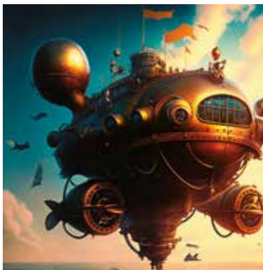
Les aventures fantastiques de Georges Méliès

Inspirées du roman de Jules Verne, Les Aventures fantastiques de Georges Méliès retracent les épopées périlleuses du professeur Maboul parti à la conquête du pôle Nord grâce à son invention : l'aérobous. Ce film muet est mis en musique par dix musiciens.